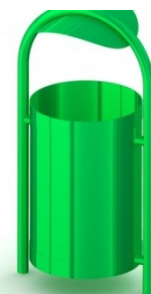
Fot.12 Przykładowe zdjęcie

Kotwienie – urządzenie na stałe posadowione w gruncie, betonowane betonem klasy min. B-15.