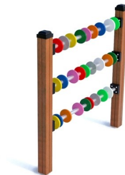
Fot.7 Przykładowe zdjęcie

Dodatki – belki konstrukcyjne osłonięte kapturkami z tworzywa sztucznego. Łby śrub, nakrętki osłonięte plastikowymi zaślepkami. Nakrętki kołpakowe z łbem kulistym.