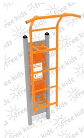
Fot.3 Przykładowe zdjęcie

Konstrukcja nośna oraz pozostałe elementy wykonane z rur stalowych ocynkowanych i malowanych proszkowo. Stopnice wykonane z blachy stalowej ocynkowanej i malowanej proszkowo. Nakrętki kołpakowe ocynkowane zabezpieczone przed odkręceniem, łożyska zamknięte bezobsługowe. Urządzenie powinno być wyposażone w amortyzatory gumowe tłumiące uderzenia. Urządzenie na stałe posadowione w gruncie, betonowane betonem klasy min. B-15.