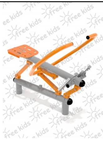
Fot.2 Przykładowe zdjęcie

Konstrukcja nośna oraz pozostałe elementy wykonane z rur stalowych ocynkowanych i malowanych proszkowo. Stopnice wykonane z blachy stalowej ocynkowanej i malowanej proszkowo. Nakrętki kołpakowe ocynkowane zabezpieczone przed odkręceniem, łożyska zamknięte bezobsługowe. Urządzenie powinno być wyposażone w amortyzatory gumowe tłumiące uderzenia. Urządzenie na stałe posadowione w gruncie, betonowane betonem klasy min. B-15.