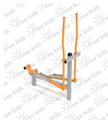
Fot.5 Przykładowe zdjęcie

ocynkowanych i malowanych proszkowo. Stopnice wykonane z blachy stalowej ocynkowanej i malowanej proszkowo. Nakrętki kołpakowe ocynkowane zabezpieczone przed odkręceniem, łożyska zamknięte bezobsługowe. Urządzenie powinno być wyposażone w amortyzatory gumowe tłumiące uderzenia