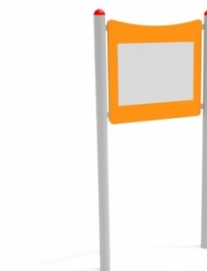
Fot.14 Przykładowe zdjęcie

Kotwienie –urządzenie na stałe posadowione w gruncie, betonowane betonem klasy min. B-15.