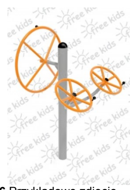
Fot.6 Przykładowe zdjęcie

Konstrukcja nośna oraz pozostałe elementy wykonane z rur stalowych ocynkowanych i malowanych proszkowo. Stopnice wykonane z blachy stalowej ocynkowanej i malowanej proszkowo. Nakrętki kołpakowe ocynkowane zabezpieczone przed odkręceniem, łożyska zamknięte bezobsługowe. Urządzenie powinno być wyposażone w amortyzatory gumowe tłumiące uderzenia. Urządzenie na stałe posadowione w gruncie, betonowane betonem klasy min. B-15.