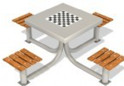
Fot.8 Przykładowe zdjęcie

Dodatki – belki konstrukcyjne osłonięte kapturkami z tworzywa sztucznego. Łby śrub, nakrętki osłonięte plastikowymi zaślepkami. Nakrętki kołpakowe z łbem kulistym.