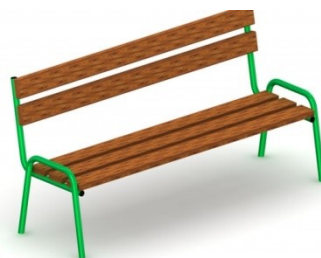
Fot.11 Przykładowe zdjęcie

Urządzenie na stałe posadowione w gruncie, betonowane betonem klasy min. B-15.