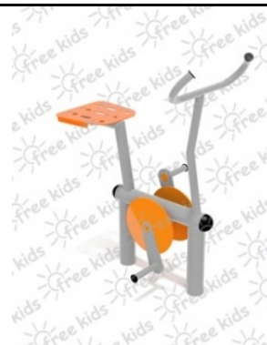
Fot.1 Przykładowe zdjęcie

Konstrukcja nośna oraz pozostałe elementy wykonane z rur stalowych ocynkowanych i malowanych proszkowo. Stopnice wykonane z blachy stalowej ocynkowanej i malowanej proszkowo. Nakrętki kołpakowe ocynkowane zabezpieczone przed odkręceniem, łożyska zamknięte bezobsługowe. Urządzenie powinno być wyposażone w amortyzatory gumowe tłumiące uderzenia.