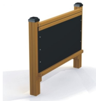
Fot.9 Przykładowe zdjęcie

Dodatki – belki konstrukcyjne osłonięte kapturkami z tworzywa sztucznego. Łby śrub, nakrętki osłonięte plastikowymi zaślepkami. Nakrętki kołpakowe z łbem kulistym.