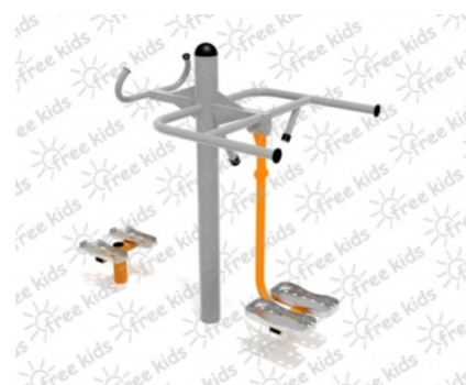
Fot.4 Przykładowe zdjęcie

Konstrukcja nośna oraz pozostałe elementy wykonane z rur stalowych ocynkowanych i malowanych proszkowo. Stopnice wykonane z blachy stalowej ocynkowanej i malowanej proszkowo. Nakrętki kołpakowe ocynkowane zabezpieczone przed odkręceniem, łożyska zamknięte bezobsługowe. Urządzenie powinno być wyposażone w amortyzatory gumowe tłumiące uderzenia